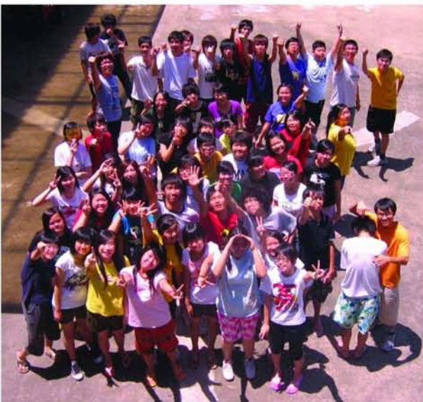
Youth Camp 2008